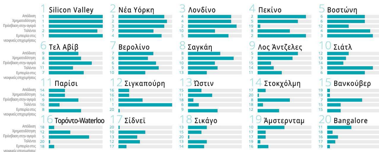
Πίνακας 2. Παγκόσμια Κατάταξη Οικοσυστημάτων Νεοφυών Επιχειρήσεων για το 2017