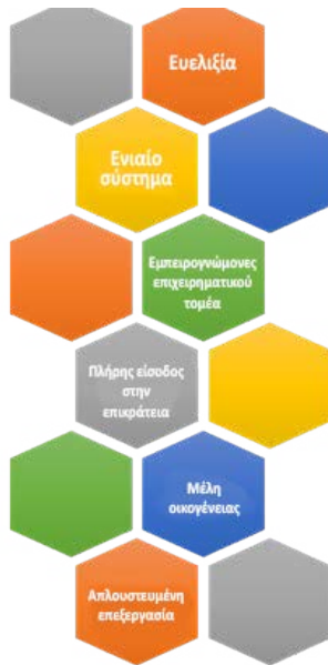
Σχήμα 1. Βασικοί προβληματισμοί του ισπανικού προγράμματος για νεοφυείς επιχειρήσεις